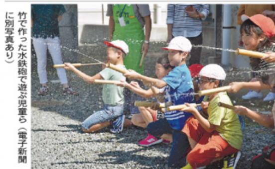
竹で作った水鉄砲で遊ぶ児童ら（電子新聞に別写真あり）